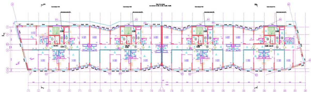
Схема расположения квартиры на этаже корпуса №4